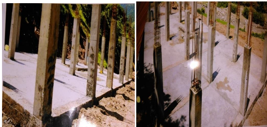
लेखापरीक्षण अवधिको प्रगतिको अवस्था

३२ प्रतिशत घटि रु.५१,४३,६११.०० कबोल गर्ने वि एण्ड वि विल्डर्स एण्ड सप्लायर्ससँग सम्झौता गरी लेखापरीक्षण अवधिसम्म गो.भौ.नं. ३०७६।४।०१ बाट प्रथम रनिड बिलका रु.३,०२४,५७५.०० भुक्तानी दिएको छ । विस्तृत डिजाइन र लागत अनुमान तयार नगरी बजेटको आधारमा टुक्रा गरी विभिन्न चरणमा काम गर्दै जाने गरी शुरु गरेको कार्यमा भुई तलाको पिलर मात्र तयार भएको निर्माण स्थलको फोटोबाट देखिन्छ । भवन निर्माण सम्पन्न भइसकेपछि जडान गर्न सकिने वधशाला सामान तथा उपकरण खरिद गरी यसै आ.व.मा रु.११,३४,४७७.०० भुक्तानी दिएको देखियो । जडान गर्ने स्थान यकिन नभई सामग्री सोभै खरिद गरी भण्डारण गरेर राख्दा बजेट खर्च गर्ने उद्देश्यले हतारमा खरिद गरेको देखिन्छ । सम्पन्न नहुने गरी टुक्रा गरी निर्माण कार्य गराएको तथा जडान गर्ने स्थान तयार नभई उपकरण तथा सामग्री खरिद गरेको नियमित देखिन आएको छैन । खरिद कार्य व्यवस्थित गरी निर्माण सम्पन्न गराई सञ्चालनमा ल्याउने सम्बन्धमा कार्यालयले प्राथमिकता दिनुपर्ने देखिन्छ ।